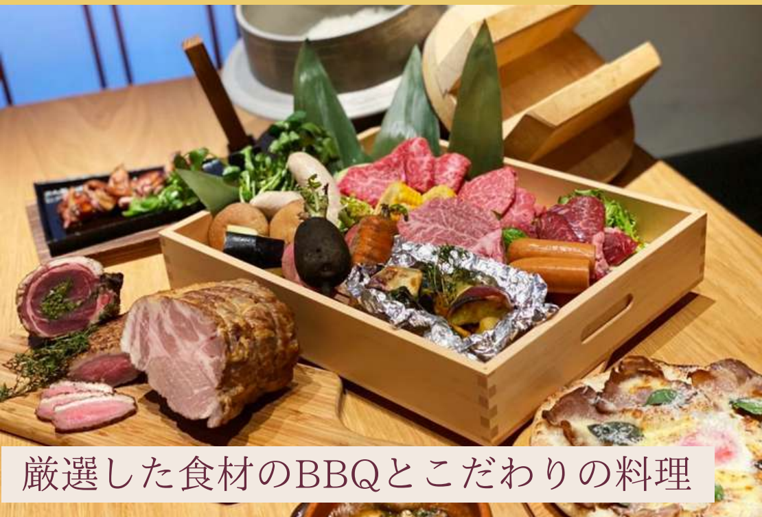
厳選した食材のBBQとこだわりの料理