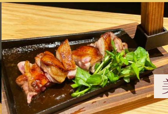
美山地鶏のくわ焼き